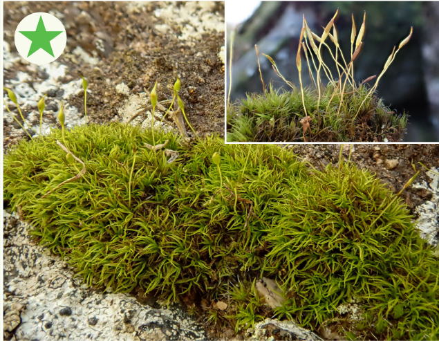
Fforch-fwsogl Scott Dicranum scottianum

Cynefin: creigiau asid o dan gysgod, coed o bryd i'w gilydd Ffurf twf: yn ffurfio clustogau trwchus yn aml Nodweddion allweddol: 1. Gwyrdd tywyll, gwyrdd canolig neu felynwyrdd yn achlysurol e.e. pan yn sych 2. Dail unionsyth iawn neu ychydig yn grwm, siâp blaen gwayrffon ac yn meinhaus i bwynt hir main 3. Nerf amlwg iawn 4. Dail heb ddannedd ar y cyfan 5. Coden unionsyth Rhywogaethau tebyg: Dicranum fuscescens ; dail danheddog a choden grom Nodiadau: anghyffredin