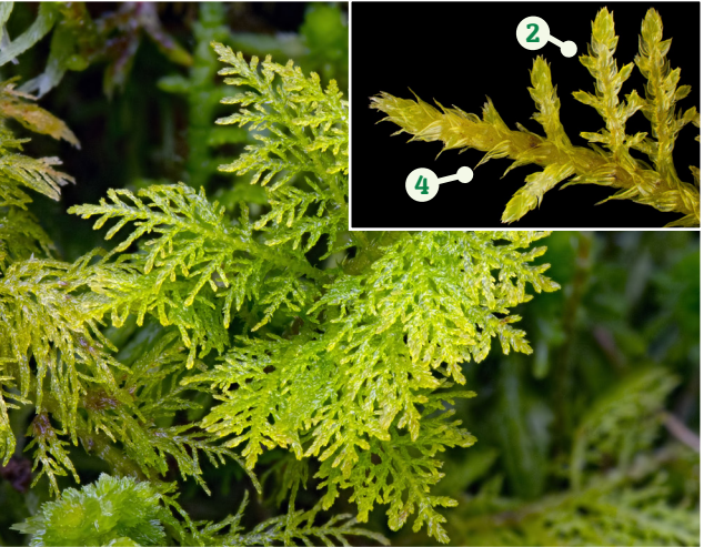
Mwsogl Grugwydden Cyffredin Thuidium tamariscinum

Cynefin: cloddiau pridd, ar lawr y coetir ac o amgylch bonion coed Ffurf twf: yn ffurfio matiau rhydd sy'n ymledu, sy'n edrych yn filr yn aml Nodweddion allweddol: 1. Coesyn brown neu wyrdd 2. 2 i 3 asgellog 3. Dail y prif goesyn yn llawer mwy na'r dail ar y canghennau dyfagos 4. Dail y prif goesyn wedi'u plethu, yn meinhaus i bwynt pigfain a gyda nerf glir 5. Coesyn wedi'i orchuddio â manflew Rhywogaethau tebyg: Thuidium delicatulum , yn tueddu i ffurfio tyweirch byrrach a mwy trwchus, ond mae'n rhaid ei gadarnhau gyda microsgop (i'w weld yn llawer llai aml na T. tamariscinum ) Nodiadau: cyffredin iawn mewn ystod eang o gynefinoedd