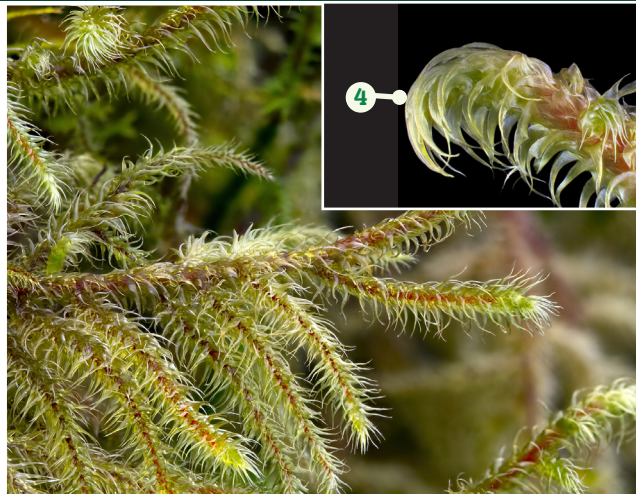
Mwsogl Blewog Bach Rhytidiadelphus loreus

Cynefin: ar lawr y coetir, bonion coed, cloddiau pridd a thros glogfeini isel Ffurf twf: yn ffurfio drwy ledaenu matiau blêr, rhydd, sbringlyd Nodweddion allweddol: 1. Coesyn coch 2. Dail crwm heb nerf glir 3. Dail llydan yn y bôn, yn meinhaus i bwynt main hir 4. Dail ar flaen y prif egin yn crymu i'r un cyfeiriad h.y. crymanog 5. 1-asgellog Rhywogaethau tebyg: Rhytidiadelphus triquetrus ; fel arfer yn fwy gyda dail yn ymestyn allan i bob cyfeiriad gan wneud iddo edrych yn sigledig. Rhytidiadelphus squarrosus ; y dail ym mlaen y prif egin ddim yn grymanog (yn llawer llai cyffredin fel rheol nag R. loreus mewn coedwig law dymherus) Nodiadau: cyffredin iawn mewn amrywiaeth o gynefinoedd