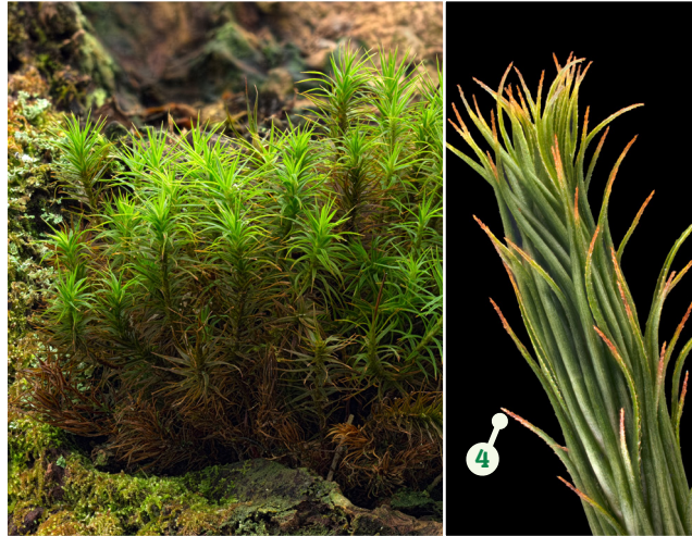
Cap Gwallt Clawdd Polytrichum formosum

Cynefin: ar gloddiau pridd fel rheol, ar lawr y coetir ac o amgylch bonion coed, yn ffurfio clustogau mawr a thrwchus yn aml Ffurf twf: egin cadarn unionsyth yn ffurfio twmpathau rhydd Nodweddion allweddol: 1. Egin unionsyth, heb ganghennau ac mewn poblogaethau trwchus fel rheol 2. Dail hir, cul a phigfain 3. Egin yn edrych fel 'brwsh potel' 4. Gwain waelodol y ddeilen ychydig yn hirach na llydan (o'i gweld gyda lens llaw ar ôl tynnu deilen oddi ar y coesyn) Rhywogaethau tebyg: Polytrichum commune ; gwain waelodol y ddeilen yn llawer hirach na llydan ac yn llai cyffredin na P. formosum mewn coetir Nodiadau: cyffredin