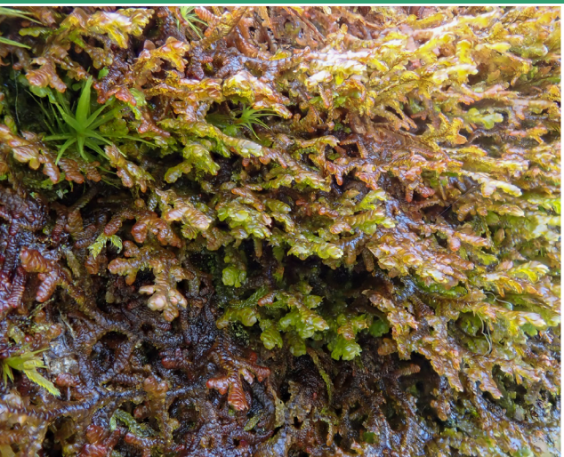
Cenllys Grugwydden Frullania tamarisci

Cynefin: creigiau a choed Ffurf twf: yn ffurfio clytiau sy'n lledaenu'n eang ac yn pwysu'n agos fel rheol at y swbstrad ond weithiau'n drwchus Nodweddion allweddol: 1. Brown cochlyd neu gopraidd fel rheol, weithiau'n wyrddach ar flaen yr egin 2. Deilen siâp ŵy, gyda blaen mwy pigfain weithiau 3. Llabedyn bach siâp helmed (hirach na llydan) ym môn y prif labled (edrychwch o'r gwaelod i fyny) 4. Llinell o gelloedd tywyllach i fyny canol prif labled y ddeilen (gweladwy gyda lens llaw) Rhywogaethau tebyg: Mae gan F. dilatata labledau crwn (nid pigfain), llabedynnau mwy sydd hefyd yn fwy crwn ac ar goed fel rheol. Mae F. teneriffae yn debyg iawn ond yn brinnach ac yn aml yn arfordirol. Nid oes gan y naill rywogaeth na'r llall llinell o gelloedd tywyllach yng nghanol y prif labled Nodiadau: cyffredin