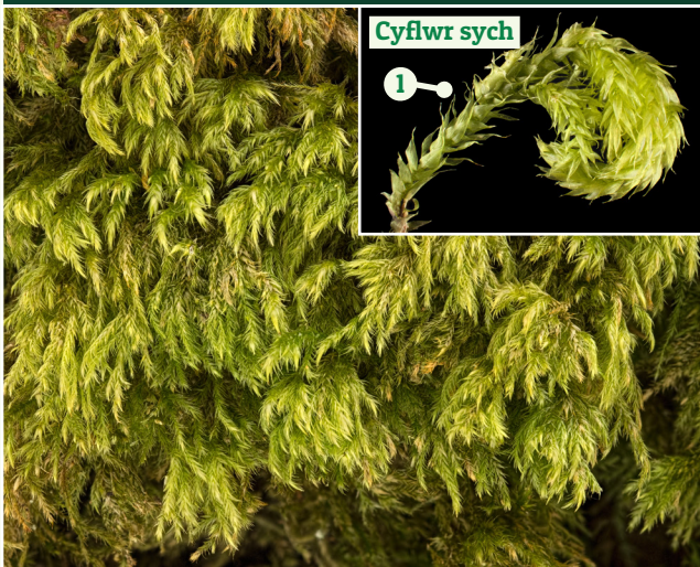
Cynffon Llygoden Isoetecium myosuroides

Cynefin: boncyffion coed a chlogfeini Ffurf twf: yn ffurfio matiau trwchus fel rheol Nodweddion allweddol: 1. Dail â nerf ganolig glir a blaen hir a phigfain 2. Prif goesyn heb ganghennau oddi tanodd a changhennau trwchus uwch ben 3. Gwyrdd plaen neu felynwyrdd 4. Ffurf twf tebyg i goeden, sy'n amlwg pan fyddwch chi'n tynnu coesyn i fyny neu'n ei wahanu o'r gweddill Rhywogaethau tebyg: Isoetecium holtii ; poblogaethau gyda lliw efydd neu frown fel rheol ac yn gadarnach. Isoetecium alopecuroides ; dail byr siâp ŵy gyda phig llydan yn y blaen Nodiadau: cyffredin iawn mewn ystod eang o gynefinoedd