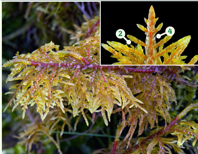
Mwsogl y Coed Pefriol Hylocomium splendens

Cynefin: cloddiau pridd, bonion coed a thros glogfeini isel Ffurf twf: mewn clytiau sy'n lledaenu'n rhydd yn gyffredinol Nodweddion allweddol: 1. Coesyn coch 2. 2 i 3 asgellog 3. Dail heb nerf glir 4. Dail ar y prif goesyn gyda blaenau pigfain a thonnog 5. Dail y coesyn yn llawer mwy na dail y canghennau Rhywogaethau tebyg: Pleurozium schreberi , blaen di-fin i ddail y prif goesyn ac 1-asgellog Nodiadau: cyffredin iawn