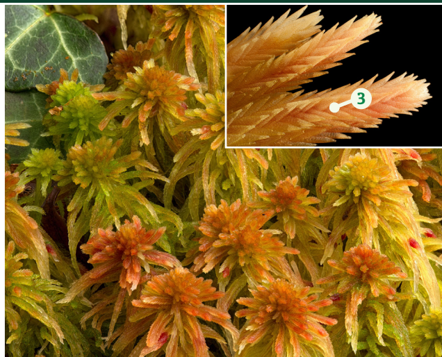
Mwsogl y Gors Pum Rheng Sphagnum quinquefarium

Cynefin: ar dir wedi'i ddraenio'n dda fel rheol e.e. ar gloddiau Ffurf twf: yn ffurfio clustogau meddal fel rheol, twmpathau neu garped dros y swbstrad Nodweddion allweddol: 1. Weithiau'n wyrdd pur ond yn aml gyda rhywfaint o liw pincfrown a brychau coch 2. Canghennau ar hyd y prif goesyn mewn clystyrau o bump fel rheol, gyda thair yn ymledu oddi wrth y coesyn a dwy wedi'u gwasgu'n agos at y coesyn 3. Dail ar ganghennau wedi'u trefnu mewn rhesi clir Rhywogaethau tebyg: mae llawer o rywogaethau o Sphagnum ac maent yn anodd eu hadnabod. Bydd y nodweddion uchod, yn enwedig nifer y canghennau gyda'i gilydd ar y coesyn, yn arwydd da o'r rhywogaeth yma. Mae'r rhywogaethau Sphagnum eraill yn y coetir sydd ag arlliwiau pinc yn cynnwys S. subnitens ac S. palustre Nodiadau: cyffredin